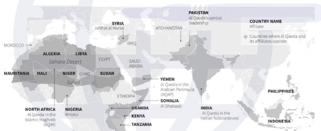
شکل ۵. شبکه بین‌المللی القاعده

القاعده با تمرکززدایی شبکه‌ای به طور فزاینده‌ای مقاومت بیشتری پیدا کرده است. درک نادرست شیوه عملکرد شبکه القاعده باعث سردرگمی استراتژی جهانی برای مبارزه با آن شده است. نخست، هیچ گروهی در قلب شبکه وجود ندارد. فرماندهی مرکزی القاعده همچنان خطوط استراتژیک شبکه را ترسیم می‌کند، اما دیگر دستورالعملی صادر نمی‌کند. دوم، اتصالات جانبی یا روابط بین گروه‌های القاعده ساختاری مشبک مانند ایجاد می‌کند که به شبکه قدرت می‌بخشد. سوم، گرچه بسیاری از وابستگان القاعده صرفاً در سطح محلی فعالیت می‌کنند، اما در اساس شبکه گسترده‌تر القاعده را تقویت می‌کنند. بنابراین، مقامات ضدتروریسم باید یک استراتژی جهانی و جامع برای مقابله با القاعده تهیه کنند.