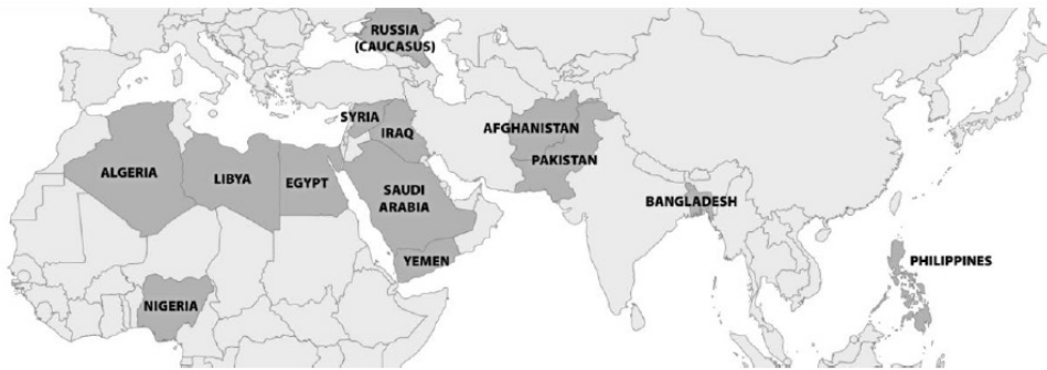
شکل ۶. شبکه بین‌المللی داعش

علاوه بر این، داعش هنوز تهدیدی فعال در عراق و سوریه به شمار می‌آید. در مارس ۲۰۱۸، داعش کنترل آخرین قطعه سرزمینی را که قبلاً در عراق و سوریه در اختیار داشت از دست داد. اما، اشتباهات تلفات سرزمینی آنها نباید به عنوان یک شکست پایدار توصیف شود. داعش اکنون به یک سازمان مخفی فعال تبدیل شده و به عنوان یک شورش در هر دو کشور عمل می‌کند. همچنین، هزاران شبه نظامی داعش به جای جنگیدن تا سر حد برای دفاع از اشغال سرزمین خود، به مناطق مرزی روستایی واقع در عراق و سوریه عقب‌نشینی کردند و در آنجا به جوامع هم‌دل پناه بردند. در واقع، پنتاگون تخمین می‌زند که داعش بین ۲۰ تا ۳۰ هزار عضو دارد که تقریباً به طور مساوی بین عراق و سوریه تقسیم شده‌اند و از موقعیت خوبی برای تجدید سازمان و بازسازی سلطه خود برخوردار است. در دهه ۲۰۲۰ این احتمال وجود دارد که این افراد پناهنده یا خود داعش یا چیزی شبیه به آن را دوباره سازماندهی و از نو تشکیل دهند.